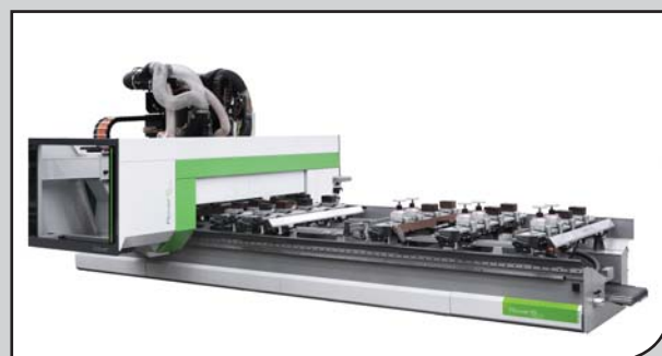
Machine à commande numérique Biesse ROVER B EDGE.